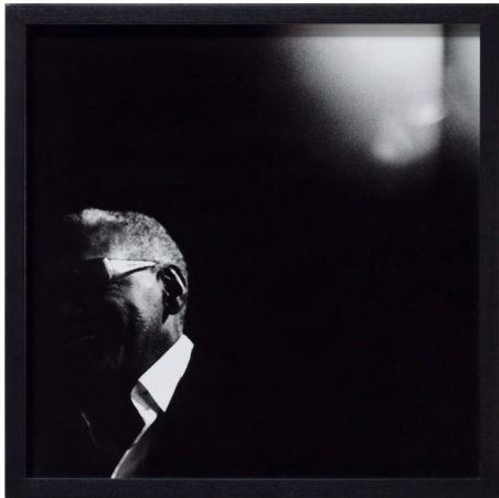
Ray Charles, Interview, 1991