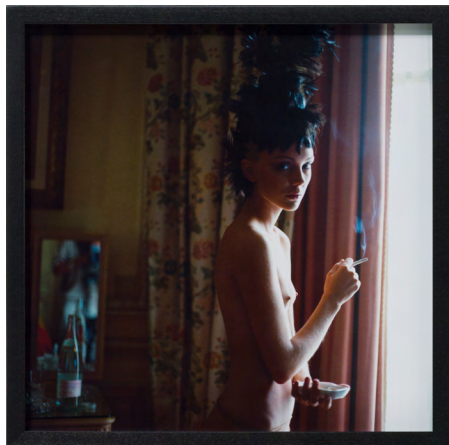
Chanel Story, Stern, 1996